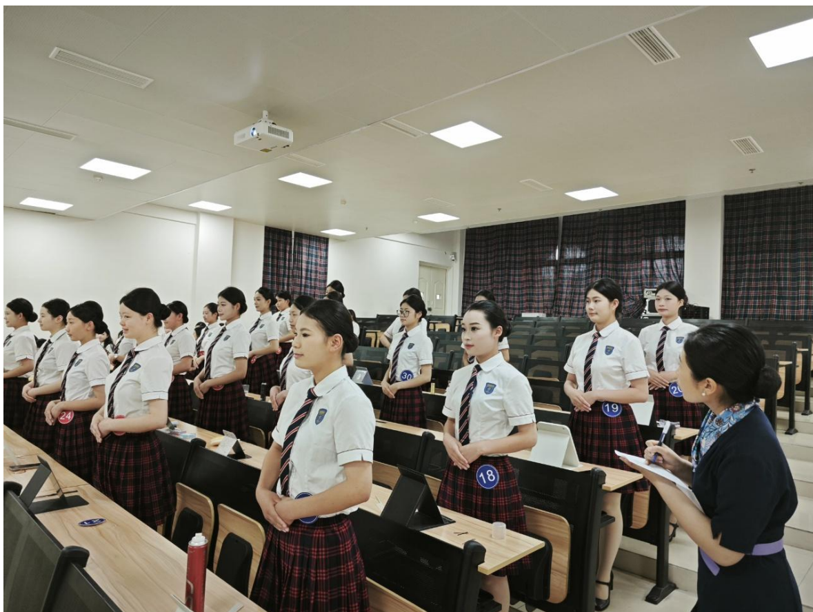
图 4-6 航空服务专业学生进行专业技能比赛