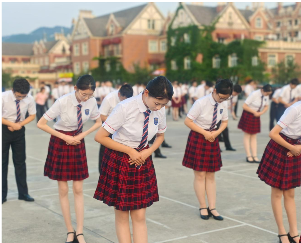
图 3-2 学生参加礼仪站位训练

学校实行标准化管理，每日开展军体训练，每周进行“常规七项”考核，培养学生纪律意识、团队协作与坚韧品格。空乘空保系举办技能大赛，设置翻轮胎、杠铃快艇、跳绳、礼仪展示等项目，强化学生体能、敏捷度与职业形象。无人机足球、穿越机