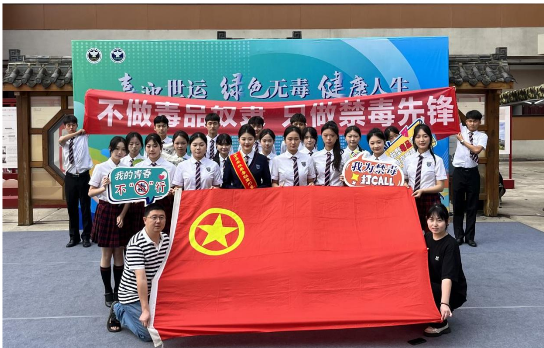
图 4-4 学校受邀参加金堂县国际禁毒日宣传月活动

学校积极响应政府号召，主动参与区域社会治理与平安建设。2025年6月6日，师生代表参与了成都市禁毒宣传月金堂县分会场活动暨全民禁毒宣传启动仪式，彰显了学校共建无毒社区的坚定立场。此外，学校常态化开展法治、交通、消防等安全主题教育活动，并通过“小手拉大手”等形式辐射家庭与社区，有效提升了师生及周边居民的安全防范意识与能力，为营造安全、稳