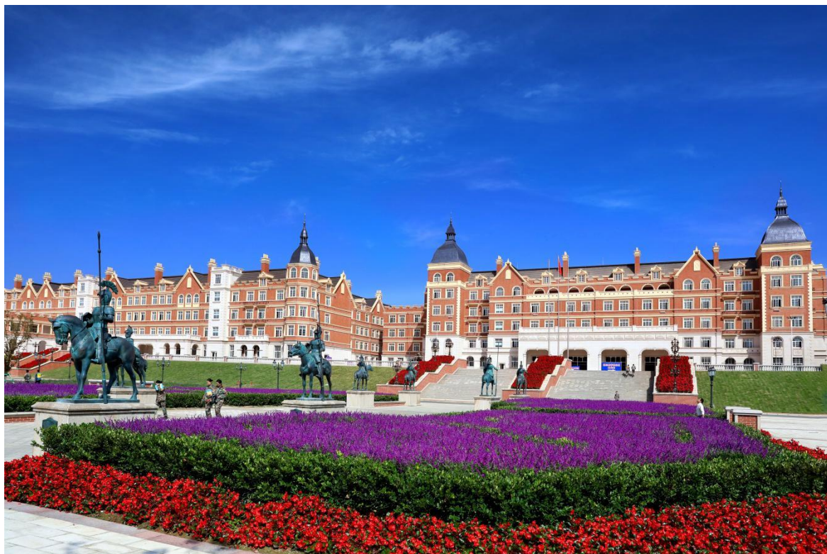
图 1-1 校园景色

学校先后被上级主管单位授予“四川省内务示范学校”“四川省职业技术教育学会会员单位”“成都市民办教育先进集体”和“成都市职教攻坚先进学校”等荣誉称号。