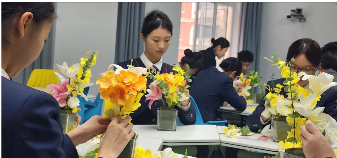
图 4-7 学生参加 CVCC 高级礼仪师插花艺术培训