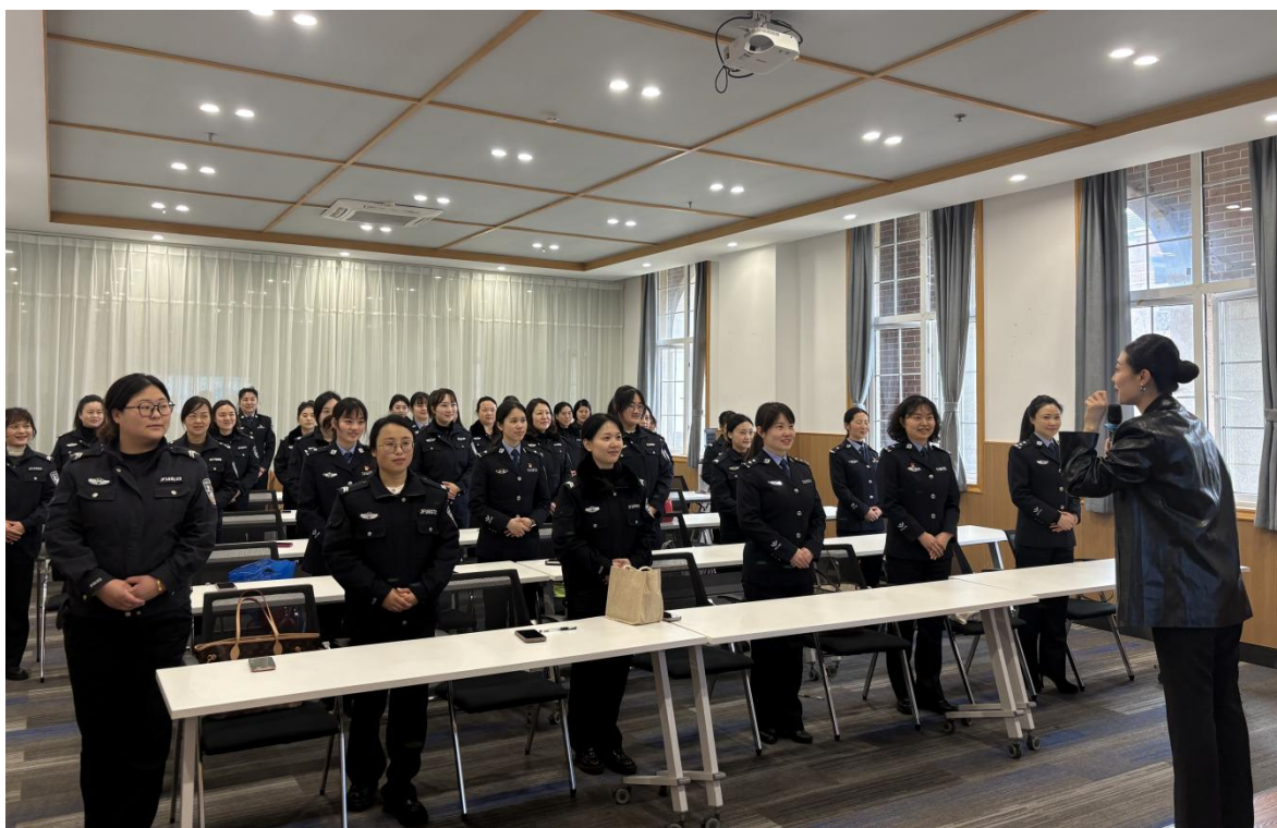
图 4-2 学校教师助力金堂县公安局开展妆点警色·礼耀芳华三八妇女节主题庆祝活动

学校依托航空服务、礼仪、化妆等专业师资与课程资源，积极为地方公共事业提供专业支持。2025 年 3 月 7 日，应金堂县