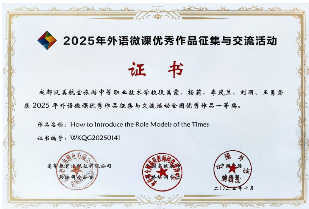
图 3-6 学校教师获 2025 年外语微课优秀作品征集与交流活动全国优秀作品评选活动一等奖

(2) 以赛促教成果丰硕。教师在各级各类教学竞赛中屡创佳绩。段美霞老师团队荣获 2025 年外语微课省级一等奖并推报