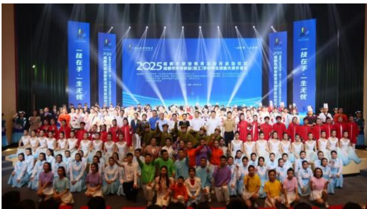
图 3-5 学校亮相 2025 年成都市职业教育活动月启动仪式

学校以活动为载体，丰富学生校园生活，促进全面发展。常态化举办各系部学生会总结与干部竞聘，提升学生自我管理与组织能力。组织学生代表参观禁毒教育基地、参与消防疏散演练、走进高校寝室文化节，拓宽视野、增强实践能力。持续落实“日行一善”德育实践活动，引导学生从小善做起，陶冶品德。创新利用抖音等新媒体平台，记录并传播校园温暖瞬间，增强师生情感联结与校园文化凝聚力。