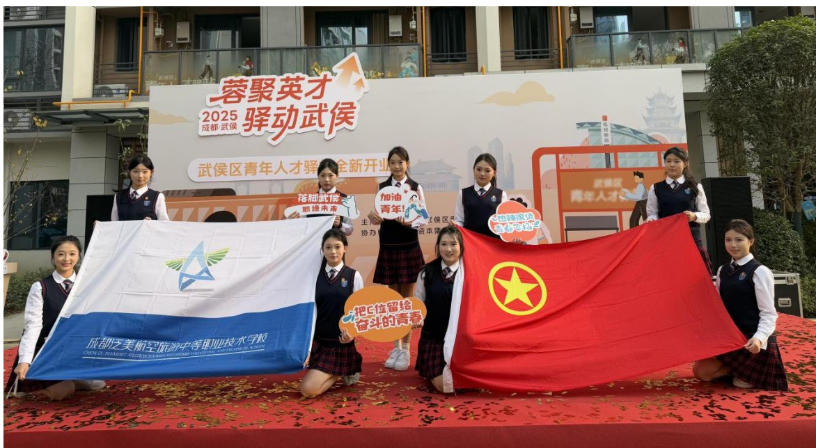
图 4-5 学校受邀参加成都市武侯区青年人才驿站开业仪式

学校主动融入区域发展大局，利用学生专业技能服务地方重要活动。2025 年 12 月 11 日，我校受邀参加成都市武侯区青年人才驿站开业仪式，学子们以一场充满朝气与专业素养的开场舞表演，为这一服务青年人才的重要民生项目精彩启幕，生动诠释了“成都对青年更友好，青年在成都更有为”的城市承诺，展现了职教学子的美好风貌，也加强了校地之间的情感联结与合作。