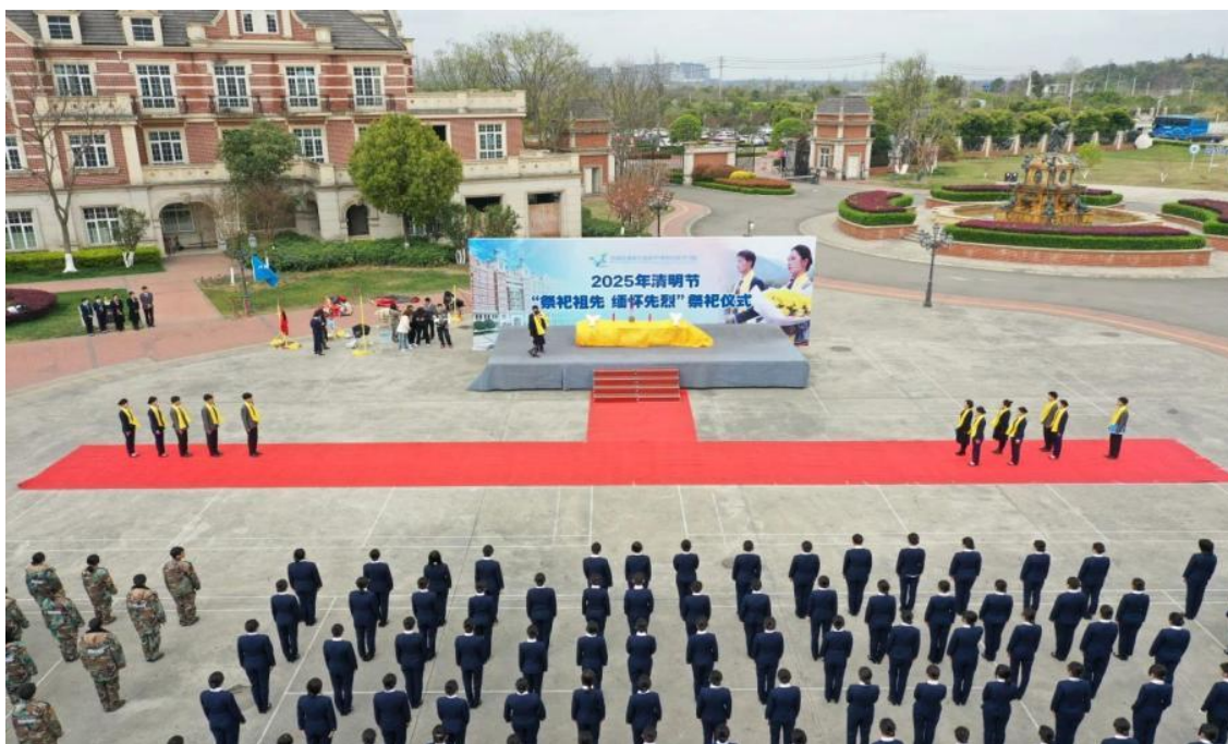
图 3-4 全校师生参加清明祭祖仪式

入礼仪课程、开展孝亲敬老与彝族助学、开发传统节日体验课程等举措,实现文化育人与专业训练深度融合。学校系统开发了《变脸艺术与客舱服务融合实训手册》,将戏曲“五法”转化为服务能力,并在养老院服务、彝族年文化节等活动中强化情感体验与职业认同。实践表明,学生文化底蕴与服务温度显著提升,彝族学生就业率提高,形成了“以文育德、以文强技”的职教新范式,为培养高素质航空服务人才提供了可复制的系统性解决方案,其“符号可视化、活动课程化”的路径对同类专业具有广泛借鉴价值。