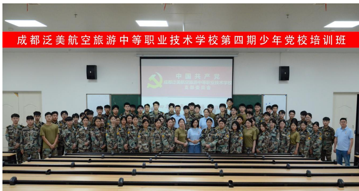
图 2-1 学校第四期少年党校培训班合影

红色基地讲解、社区服务等实践活动，并实施严格的过程评价与激励机制。培训班已成功举办多期，学员政治觉悟显著提升，多人被评为优秀学员，在校园中发挥了显著的榜样带动作用，为党组织储备了可靠的后备力量，探索出中职学校思政引领与党员梯队培养的有效机制，形成了党建带团建、团建促学风的良性循环。