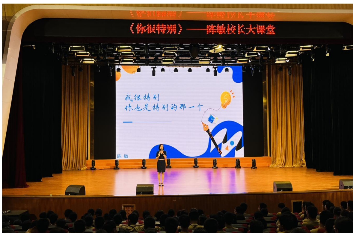
图 2-2 校长大讲堂之《你很特别》

此外，“校长大课堂”成为思政教育的重要载体。陈敏校长以《你很特别》为主题，通过互动游戏、榜样故事、哲理短片，引导学生认识自我价值，撕掉负面标签，激发内在潜能。唐昕副校长则以《我们与恶的距离》为题，创新“法律盲盒”形式，将