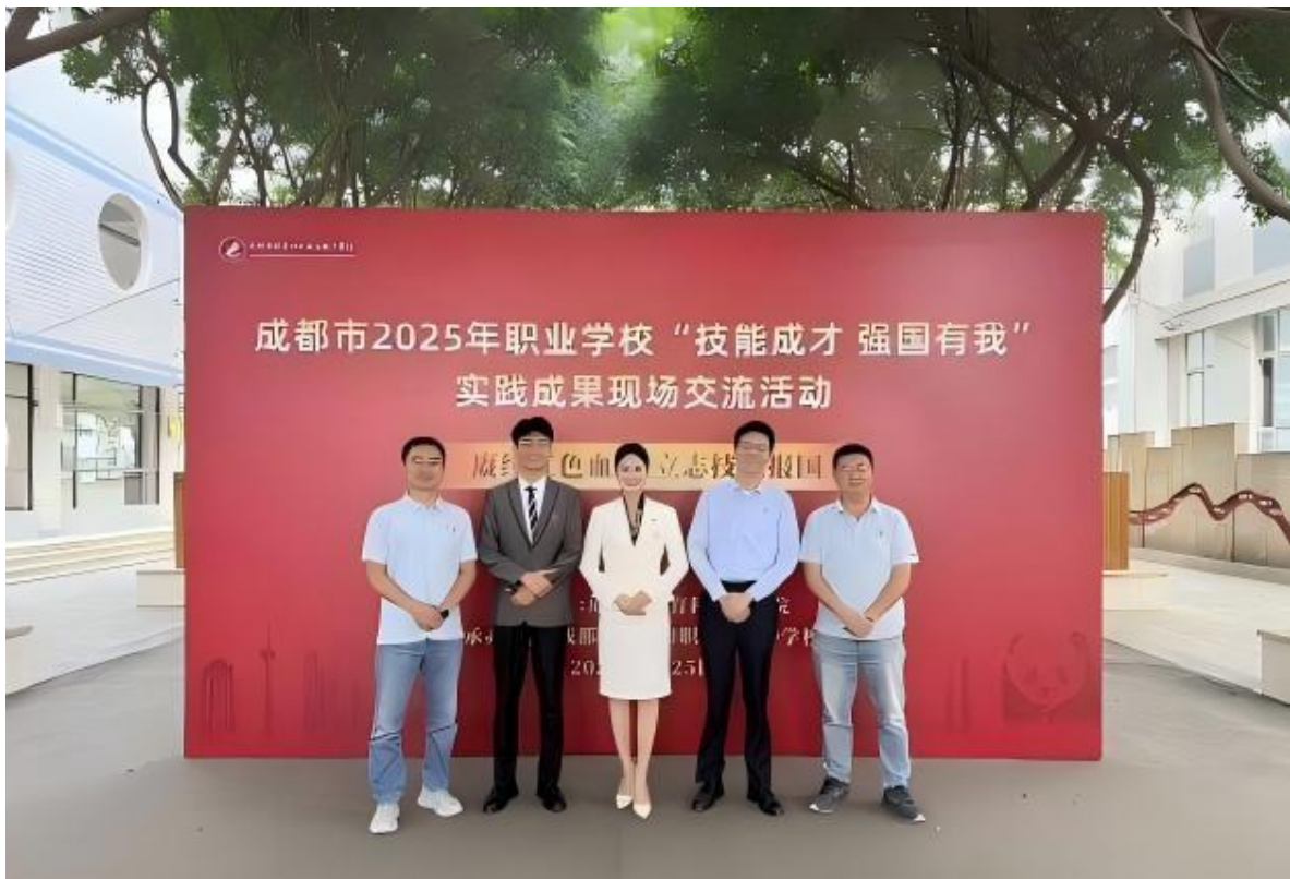
图 3-1 学校师生参加成都市“技能成才 强国有我”活动