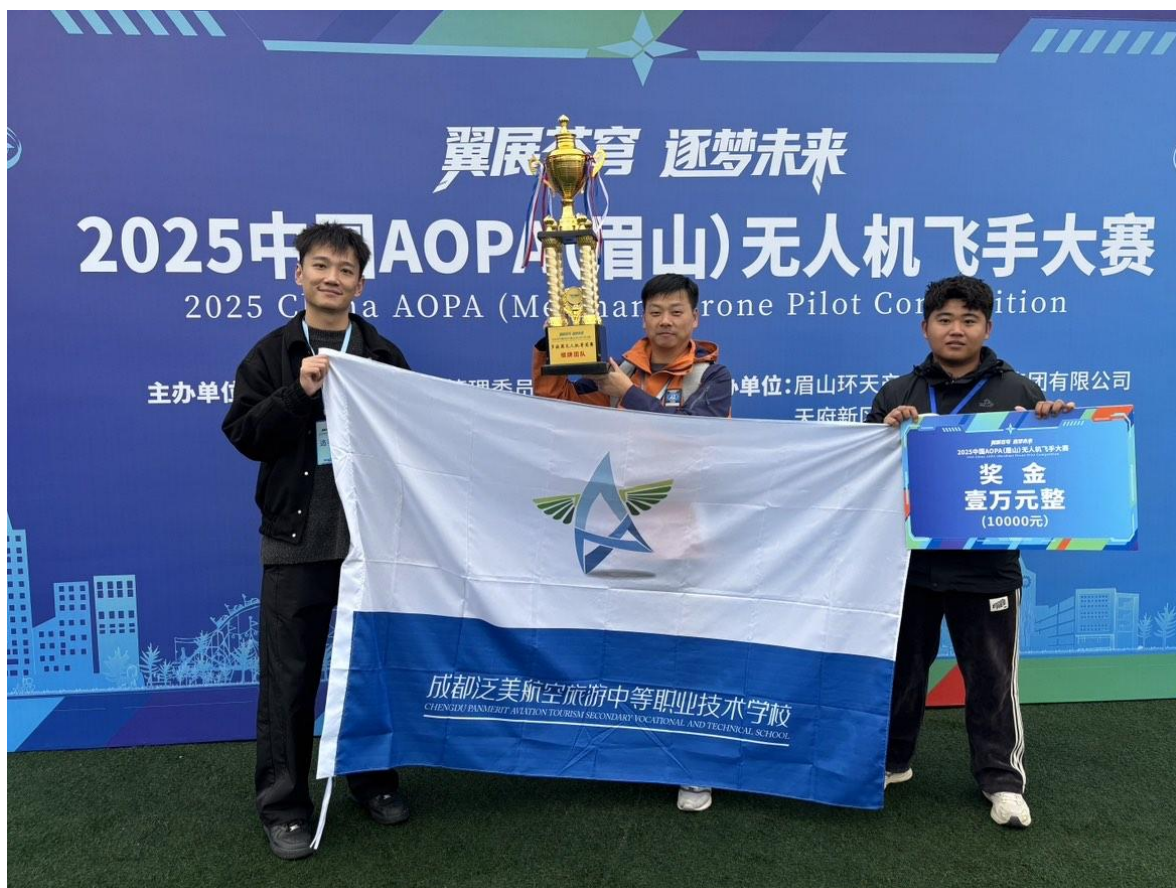
图 5-1 学校师生参加无人机飞手大赛