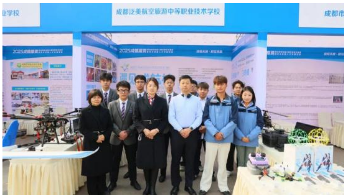
图 4-1 学校亮相成德眉资职业院校技能大赛优秀项目展演暨技术技能人才对接活动

省级一等奖 2 项，市级奖项 20 余项；教师发表（获奖）市级以上论文（案例）8 篇。这些研究成果聚焦民办中职高质量发展、专业建设、课程改革等共性关键问题，其经验通过各类交流平台得以分享，对区域职业教育教学改革起到了积极的引领和辐射作用。